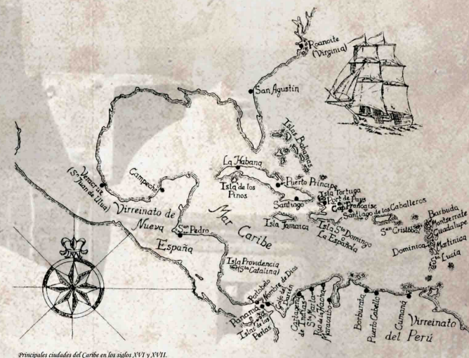
Principales ciudades del Caribe en los siglos XVI y XVII.